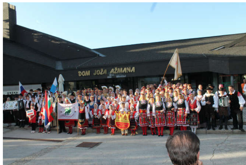
Folklorna skupina KD Bohinj in 3. Mednarodni folklorni festival v Bohinju