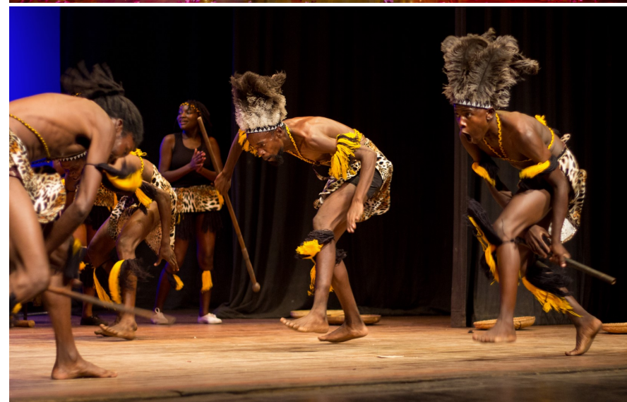
Prihaja Folkart 2023: Indonezija (zgoraj) in Zimbabve (spodaj)